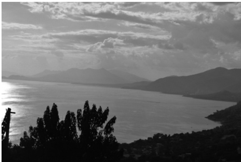
Fotografía 1. Camino a San Pedro Itzicán

San Pedro Itzicán, Agua Caliente, Chalpicote y La Zapotera. Una de las explicaciones de los habitantes, no compartida por los diversos actores sociales, políticos y de la salud externos, indica que en el lago de Chapala existen innumerables nacimientos y manantiales de agua termal, con contenidos de azufre, que se encuentra en las comunidades de mayor incidencia de enfermedades. Aunque la existencia de agua azufrosa es histórica, las localidades se abastecían hasta hace pocas décadas de agua directamente del lago de Chapala, pero el incremento de su contaminación obligó a los pobladores a utilizar las aguas termales.