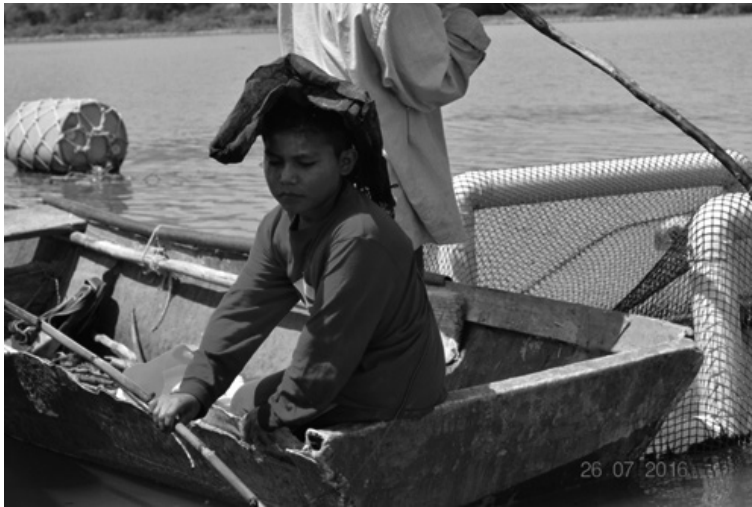
Fotografía 3. Pescadores de Mezcala de la Asunción

han llevado al cabo son la difusión a través de diversos medios de comunicación, elaborar un pliego petitorio único que se presentará ante autoridades de los tres niveles de gobierno, la planeación de eventos informativos y culturales para difundir la situación de los pobladores ribereños (notas propias de las reuniones en Mezcala de la Asunción. Mayo y junio del 2016).