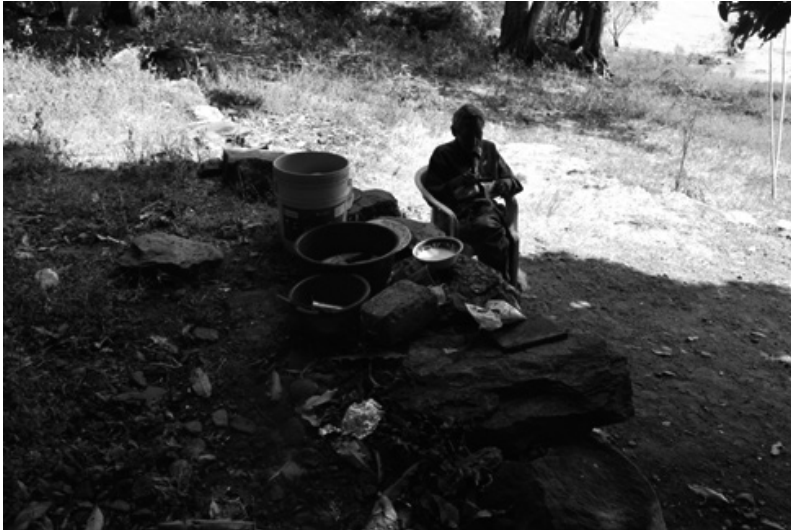
Fotografía 2. En el solar, tejiendo redes a la orilla del lago

una gran parte de las viviendas son de techo de lámina, se cocina con leña, mientras que la alimentación principal sigue siendo el pescado del lago de Chapala, y frutos y verduras que pueden obtener de sus patios o solares.